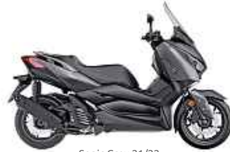
Sonic Grey 21/22

Le XMAX 125 est le scooter idéal pour ceux qui en veulent plus. Son équipement inégalé comprend le système de démarrage sans clé «Smartkey» pour une utilisation simple et directe, le système Start & Stop automatique et un moteur Blue Core économique et puissant.