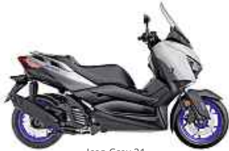
Icon Grey 21