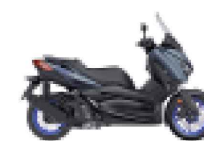
XMAX 125 / XMAX 125 Tech MAX