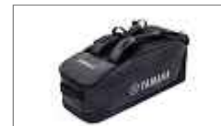
Sac de sport Yamaha Racing T18-LC009-E1-00

Les photos ci-dessus montrent une sélection de vêtements de loisirs de Yamaha. Ton partenaire officiel Yamaha peut te donner un aperçu complet des vêtements disponibles que tu trouves également sur notre site www.yamaha-motor.ch .