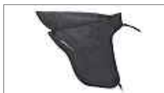
Tricity 125 Tablier thermique 2CM-F47L0-00-00