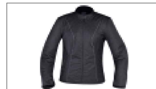
Veste urbaine pour femme A21-BJ203-B0-XX