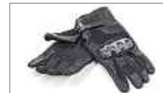
Gants pour femme A21-BG201-B0-XX