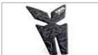
MT-125 Autocollants de réservoir B6G-FTPAD-00-00