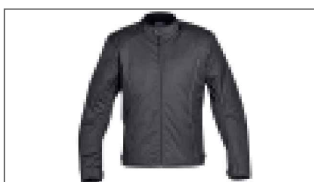
Veste urbaine pour homme A21-BJ101-B0-XX