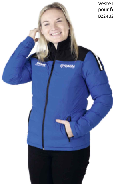
Veste Paddock Blue Team Hybrid pour femme B22-FJ223-E0