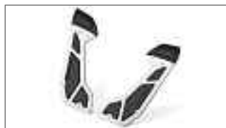
NMAX 125 Platine de marche-pieds B6H-F74M0-00-00