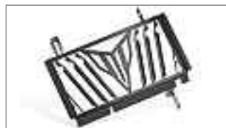
MT-125 Protection de radiateur B7D-F1557-MA-ST