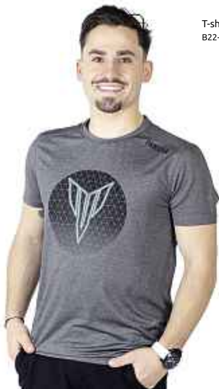
T-shirt MT pour homme B22-MT113-F0