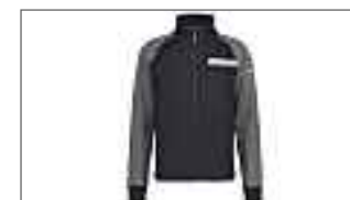
Sweatshirt REVS pour homme B19-AJ103-B1-XX