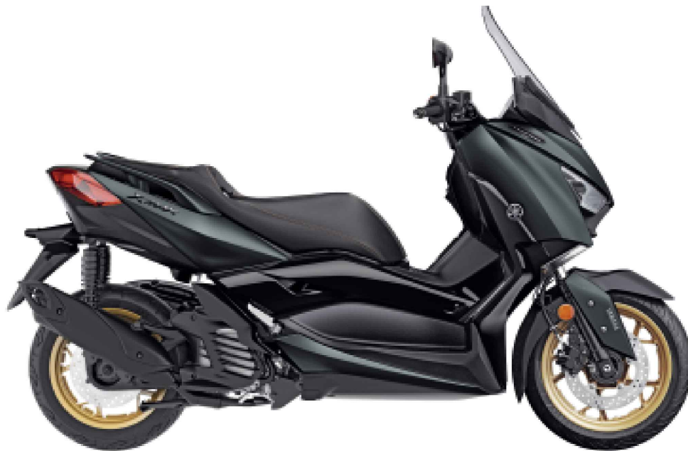
Dark Petrol 22

Conçu selon la pure tradition MAX, ce Sport Scooter 125 cm 3 haute qualité t'offre l'équilibre idéal entre sportivité, fonctionnalité et caractéristiques pratiques tout en garantissant le caractère unique MAX.