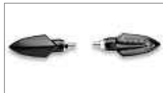
R125, XSR125, MT-125 Clignotants LED YME-H0789-00-20