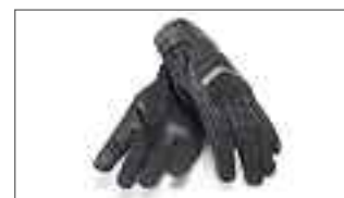
Gants d'été pour homme A20-BG112-B0-XX