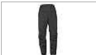
Pantalon Sport-Touring pour homme A20-BP102-B0-XX