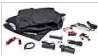
XMAX 125 Winter Pack B74-FAS00-00-00