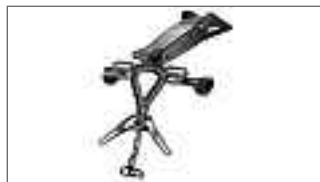
R125 Support de plaque B5G-F16E0-10-00