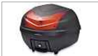
D'elight Topcase City 39L 52S-F84A8-00-00