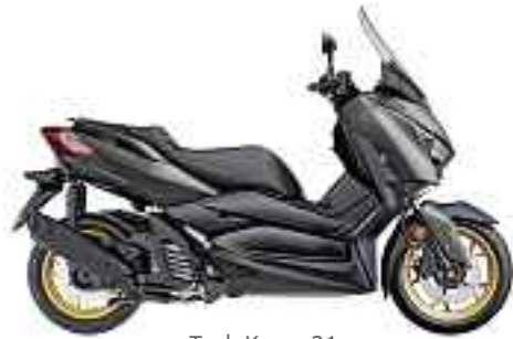
Tech Kamo 21