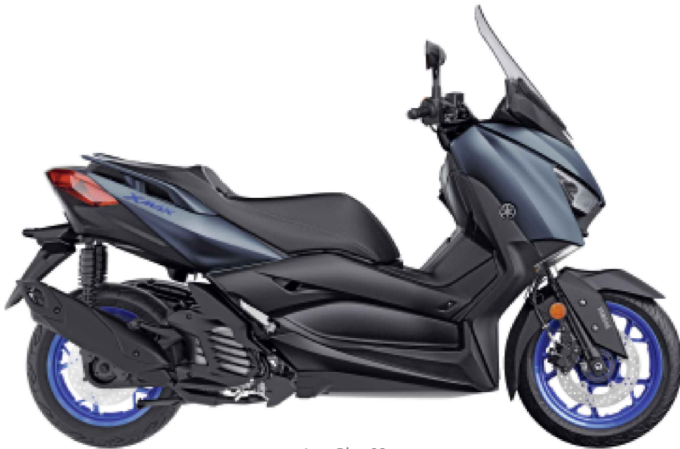
Icon Blue 22

Pour les esthètes, le Tech MAX propose une spécification haut de gamme avec des éléments tels qu'un revêtement de selle exclusif, des compartiments de rangement revêtus de cuir, des repose-pieds en aluminium ainsi que des embouts de guidon fraisés.