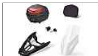
NMAX 125 Urban Pack B6H-FVUP0-00-00