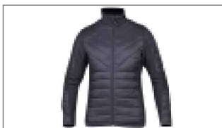
Veste de loisir «Nothing but the MAX» B21-UR204-B0-XX