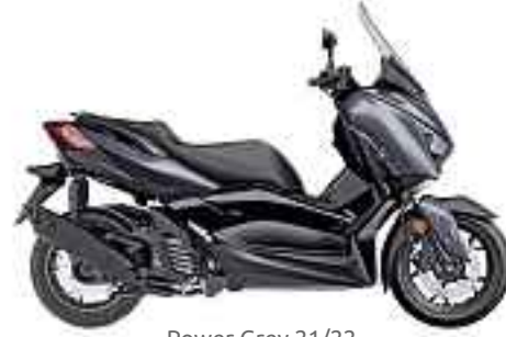
Power Grey 21/22

Ce modèle haut de gamme est une des façons les plus intelligente de se déplacer. Il est équipé d'une selle haute finition, de capitonnages en cuir, de repose-pieds en aluminium et d'embouts de guidons usinés. Le XMAX est équipé d'un nouveau moteur Blue Core de 125 cm 3 , garantissant une forte accélération à bas et moyen régimes. Le système Start & Stop réduit les émissions et améliore l'économie de carburant.